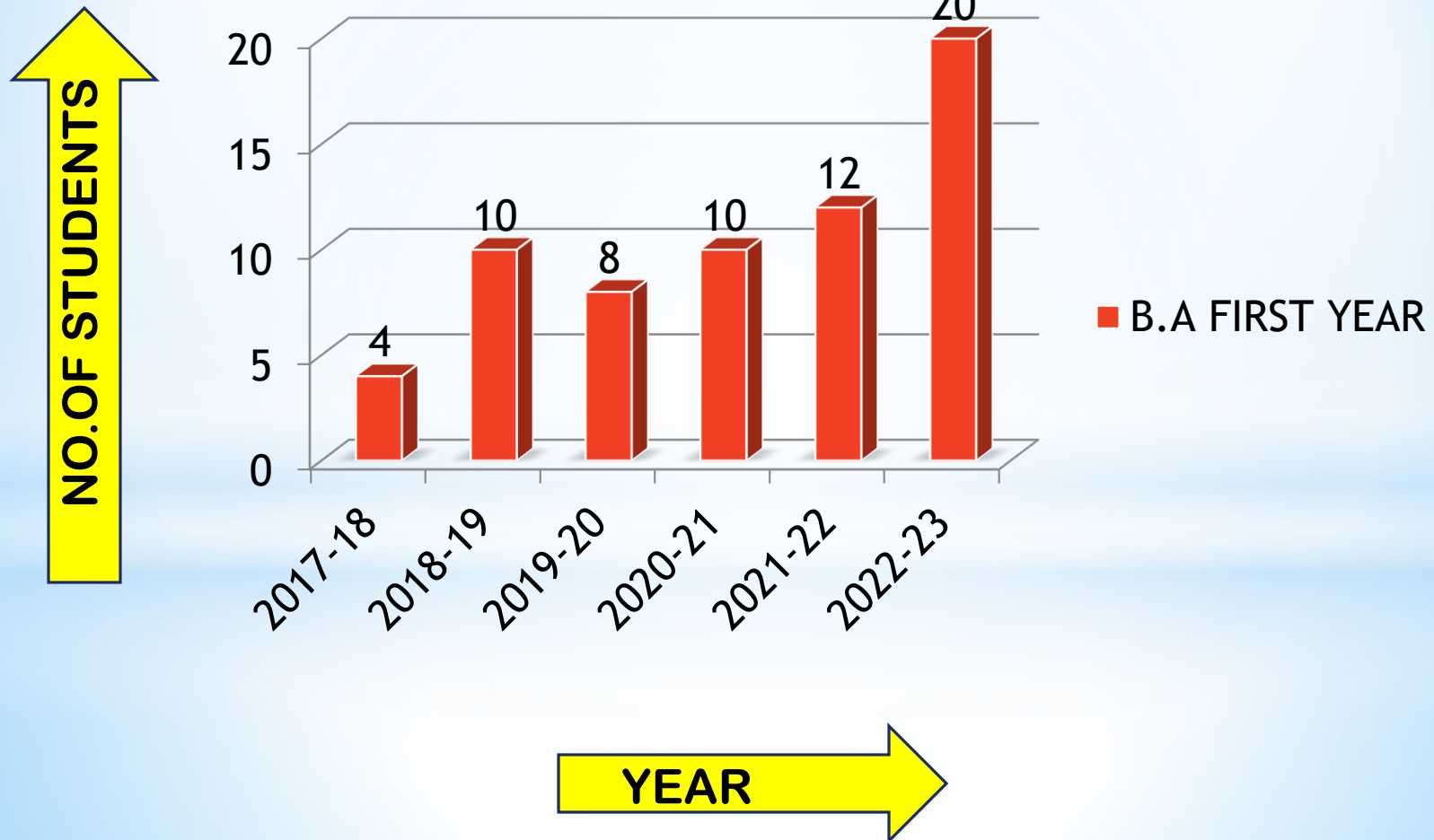
B.A FIRST YEAR